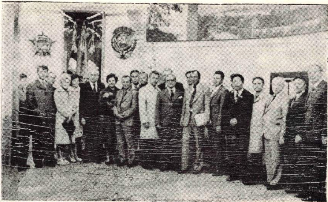
В заводском музее трудовой славы.