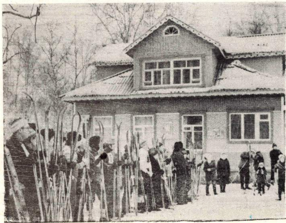
Соревнования лыжников на заводской спортивной базе.