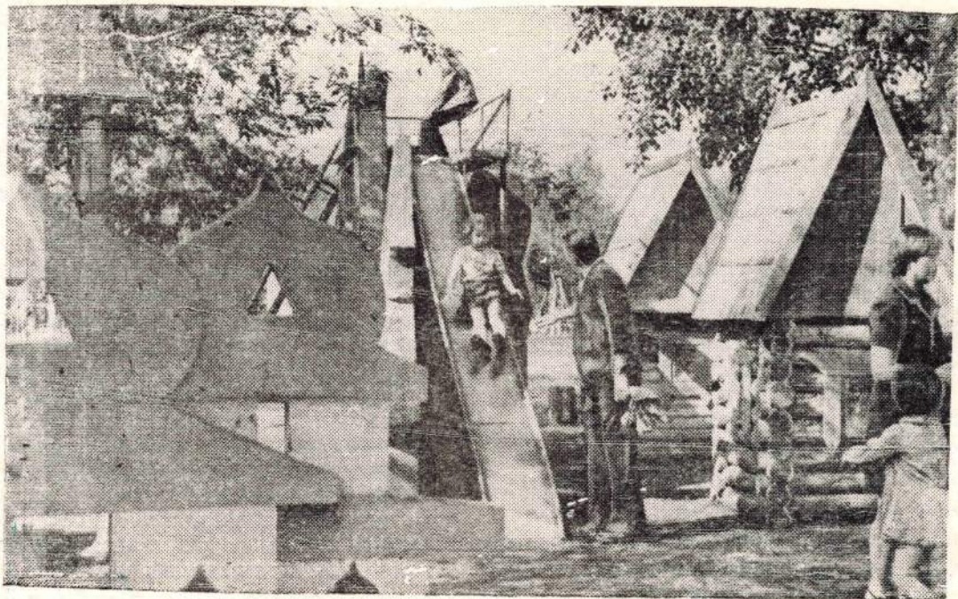
Детский городок в сквере им. 40-летия ВЛКСМ.