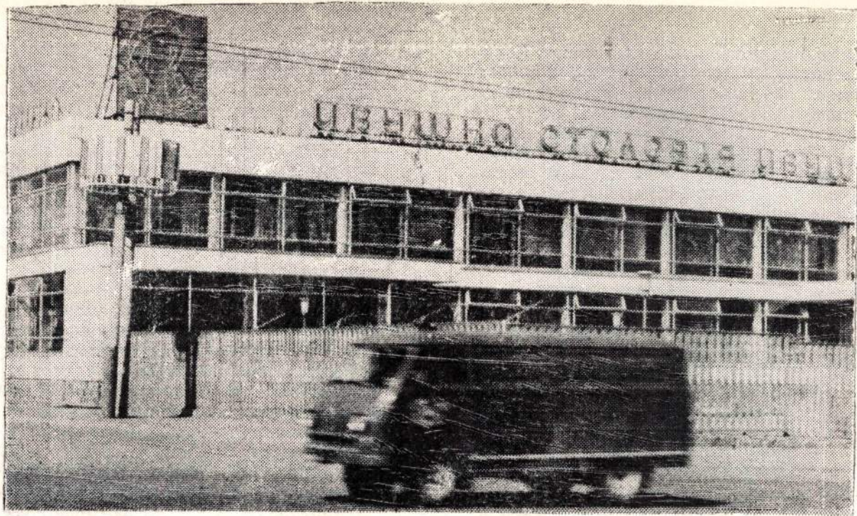
Заводская столовая «Иаушка».