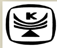
Логотип Красноярского завода телевизоров (предприятие почтовый ящик № А-3127)