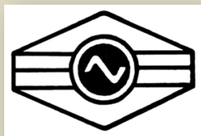
Логотип Красноярского радиозавода (предприятие почтовый ящик № 124)

На протяжении своей производственной деятельности, выпуская товарную продукцию, завод имел два наименования: Красноярский радиозавод (1952 - 1966 годы) и Красноярский завод телевизоров (1967 - 2003 годы), что нашло своё отражение в начертании логотипов предприятия.